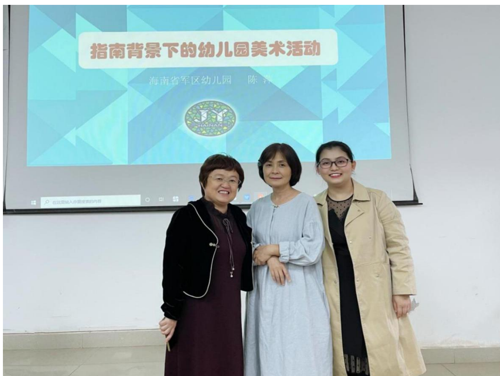
讲座结束教师合影