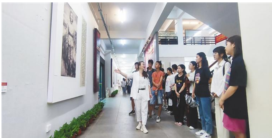
琼台师范学院美术学院的老师在学生讲解展出作品