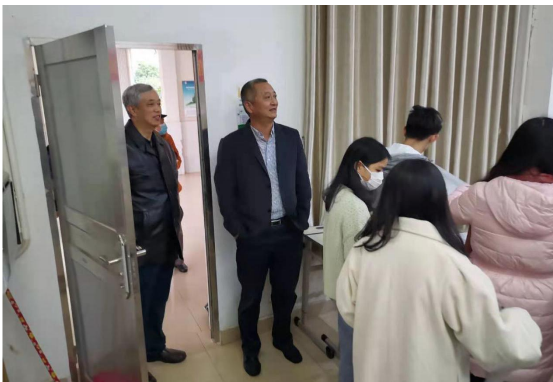
图 1. 校领导巡视期末考试考场