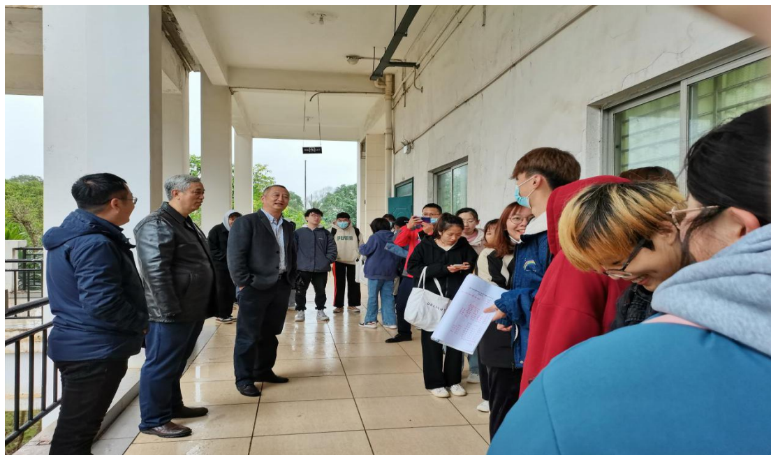
图 3. 校领导与学生亲切交谈